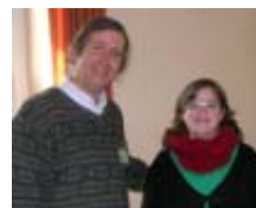
Ausente en las fotos: Scott Eavenson