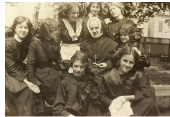
Pensionnaires et enseignante, 1912

Sainte-Anne pour illustrer les uniformes des pensionnaires